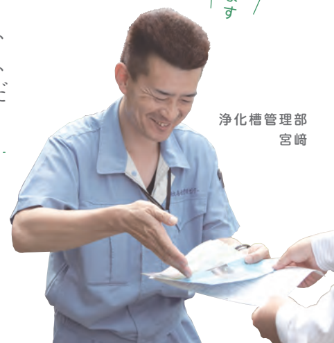
浄化槽管理部 宮崎

みなさまが快適に生活できるように様々な分野でがんばっています。何かお困りごとがありましたらお気軽にお問い合わせください。