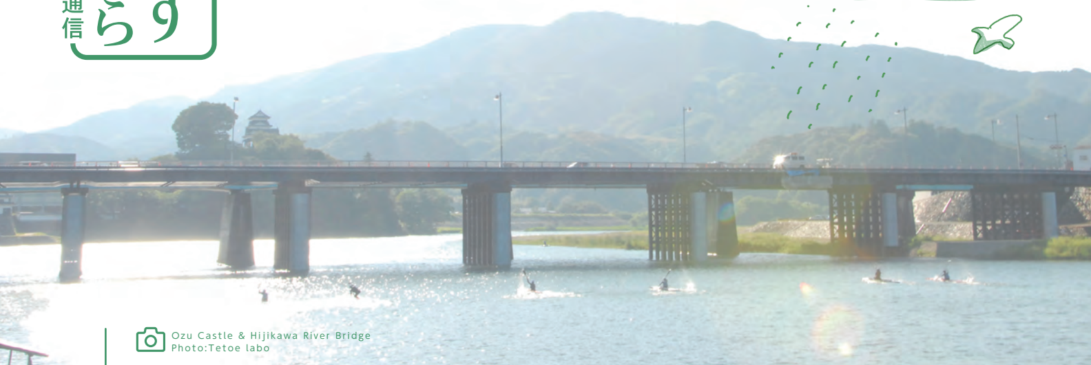
📷 Ozu Castle & Hijikawa River Bridge

I think about life from water. I do it by oneself.